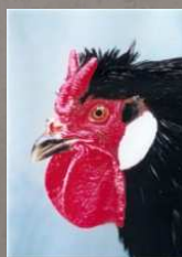
Poule la Flèche