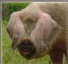
Porc Blanc de l'Ouest