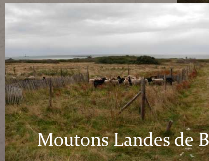
Moutons Landes de Bretagne Ile d'Hoëdic