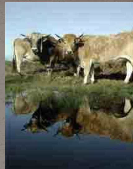
Vaches Maraîchine Marais de monts et polder de Sébastopol (85)