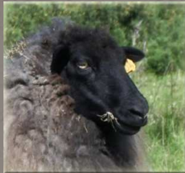
Mouton Landes de Bretagne