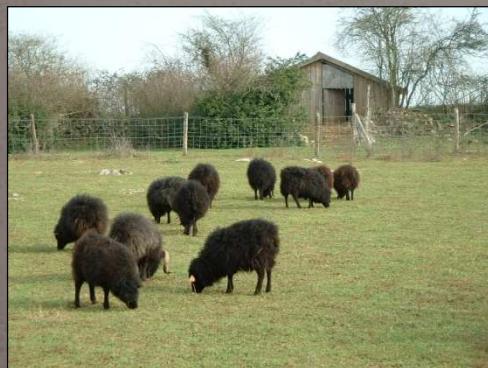
Moutons Ouessant – Grottes de Saulges