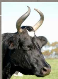
Vache Bretonne Pie Noir