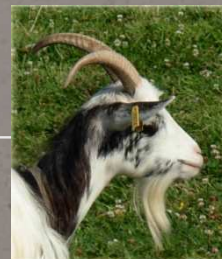
Chèvre des Fossés