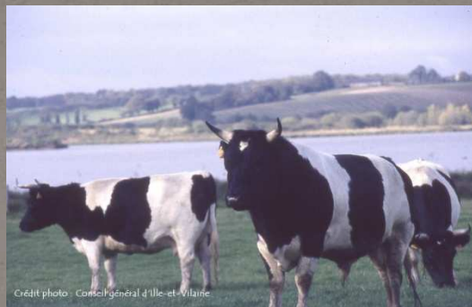
Bretonne Pie Noir Site de Careil 35 Iffendic