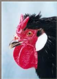
Poule la Flèche

Quelques situations sont encore fragiles