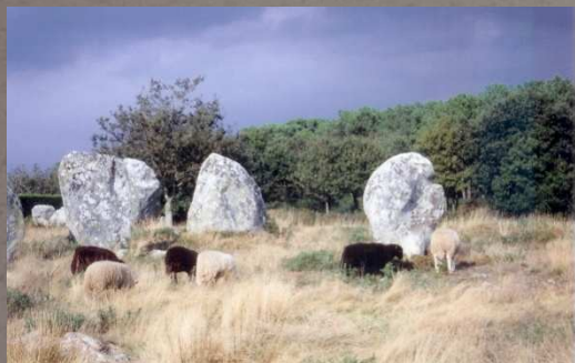
Moutons Landes de Bretagne à Carnac