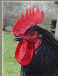
Volailles de Challans