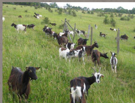
Chèvres des Fossés (CFEN Calvados)