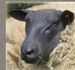
Mouton Bleu du Maine