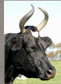
Vache Bretonne Pie Noir