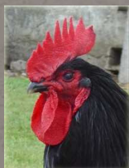
Poule Noire de Challans