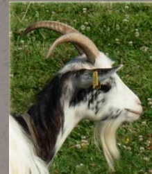
Chèvre des Fossés