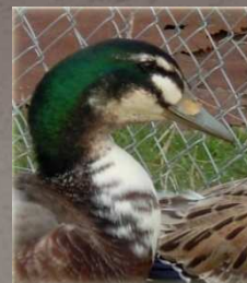
Canard de Challans