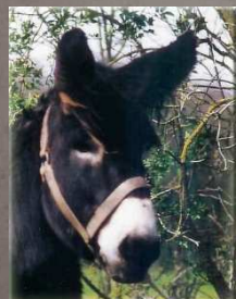
Baudet du Poitou