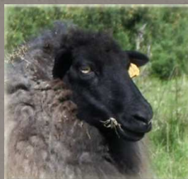
Mouton Landes de Bretagne